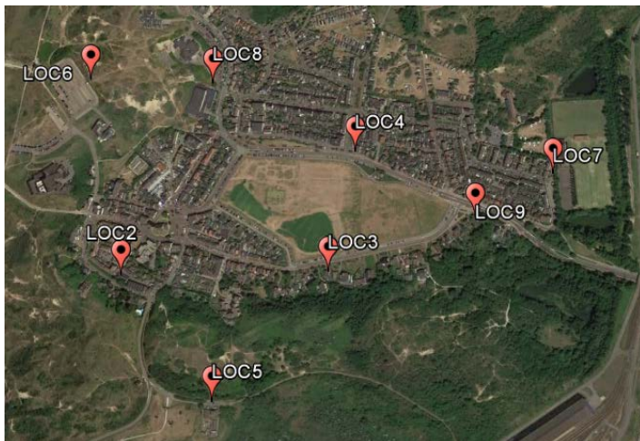
Figuur 2. Detailoverzicht van de acht benedenwindse monsternamelocaties ('LOC2-LOC9') in Wijk aan Zee